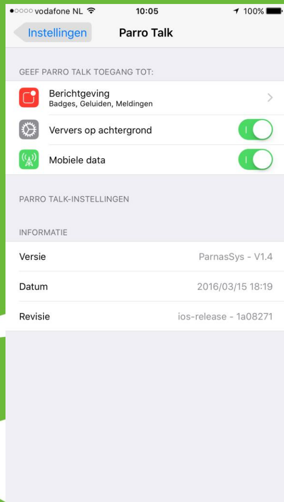
(druk op berichtgeving)